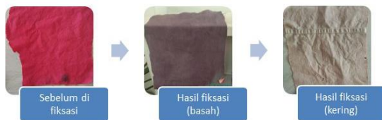
Gambar 8. Hasil pewarnaan setelah di fiksasi (Begonia+Air mineral+fiksasi tunjung)

Pada tahapan pencelupan pewarna dengan campuran tanaman begonia dan air gambut menghasilkan warna yang lebih terang. Saat di fiksasi dengan tawas, menghasilkan warna yang relatif sama saat kondisi basah dan setelah kering (gambar 9.). Sementara setelah difiksasi dengan kapur dan tunjung menghasilkan warna yang lebih pudat setelah kering.