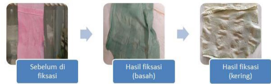
Gambar 10. Hasil pewarnaan setelah di fiksasi (Begonia+Air gambut+fiksasi kapur)