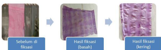
Gambar 9. Hasil pewarnaan setelah di fiksasi (Begonia+Air gambut+fiksasi tawas)

Pada tahapan pencelupan pewarna dengan campuran tanaman begonia dan air gambut menghasilkan warna yang lebih terang. Saat di fiksasi dengan tawas, menghasilkan warna yang relatif sama saat kondisi basah dan setelah kering (gambar 9.). Sementara setelah difiksasi dengan kapur dan tunjung menghasilkan warna yang lebih pudat setelah kering.