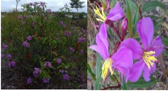
Gambar 2 Seduduk ( Melastoma malabathricum L.)

Antosianin merupakan pewarna yang paling penting dan paling tersebar luas dalam tumbuhan. Antosianin tidak mantap dalam larutan netral atau basa, karena itu antosianin harus diekstraksi dari tumbuhan dengan pelarut yang mengandung asam asetat asam hidroklorida, misalnya metanol yang mengandung HCl pekat 1% dan larutannya harus disimpan ditempat gelap serta sebaiknya didinginkan (Eibond L.S, 2004 dalam Ali, F., 2013). Terkait dengan adanya pengaruh zat asam dari sumber pewarna terhadap warna yang dihasilkan, Penulis merasa perlu melakukan penelitian pengaruh penggunaan air gambut yang memiliki kadar keasaman tinggi terhadap warna dan tingkat kecerahan hasil celupan kain pada sumber pewarna ini Pada lokasi penelitian yaitu Kebun Raya Sriwijaya yang merupakan lahan basah dengan sumber air berupa air gambut yang asam.