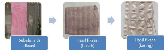
Gambar 11. Hasil pewarnaan setelah di fiksasi (Begonia+Air gambut+fiksasi tunjung)

Perubahan warna yang dihasilkan dari ketiga zat pengikat yang paling kelihatan adalah penggunaan zat pengikat kapur dan tunjung. Hal ini disebabkan kandungan besi dalam tunjung membuat warna pada kain menjadi lebih tua. Sedangkan penggunaan kapur menghasilkan warna biru muda.