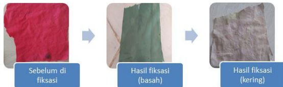
Gambar 7. Hasil pewarnaan setelah di fiksasi (Begonia+Air mineral+fiksasi kapur)