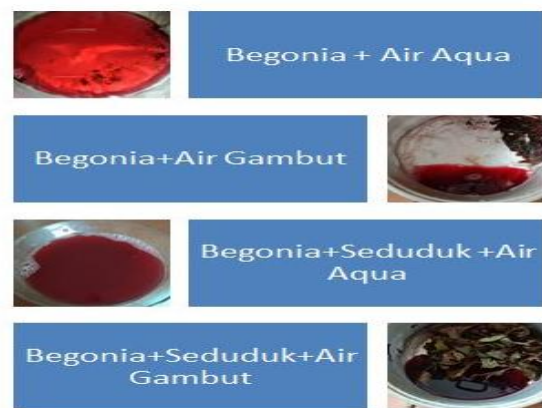
Gambar 3. Air hasil rebusan tanaman Begonia, Seduduk dan campuran keduanya

Untuk mendapatkan pewarna alami dari Begonia ( Begonia Sp. ) dan Seduduk ( Melastoma malabathricum L.), pertama bahan potong-potong, dibersihkan dan direbus dengan komposisi 350 ml air (Air gambut, air mineral) dicampur dengan 200 gram tanaman pewarna. Lamanya perebusan \pm 7-10 menit sehingga terlihat warna dari tanaman akan pekat. Setelah itu air rebusan disaring, hingga didapatkan cairan pewarna yang bersih, kemudian cairan ini didinginkan, sebelum digunakan untuk pencelupan kain. Cairan pewarna ini dapat digunakan beberapa kali dan tidak mempengaruhi kepekatan cairannya (Gambar 3).