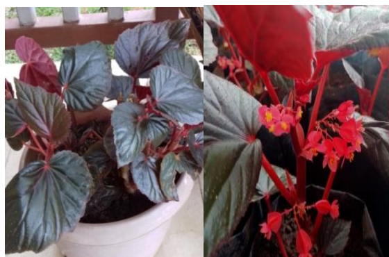
Gambar 1. Begonia Sp.

begonia sp. yang berpotensi sebagai pewarna merah adalah bagian daunnya (Efendi M, dkk, 2016).