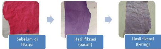
Gambar 6. Hasil pewarnaan setelah di fiksasi (Begonia+Air mineral+fiksasi tawas)

pengikat dalam proses pewarnaan dengan zat warna alam menghasilkan arah warna yang berbeda (Gambar 6,7,8). Walaupun pada tahapan pencelupan (air rebusan begonia dan air mineral) di hasilkan warna yg lebih gelap, setelah difiksasi menghasilkan warna yang beragam.